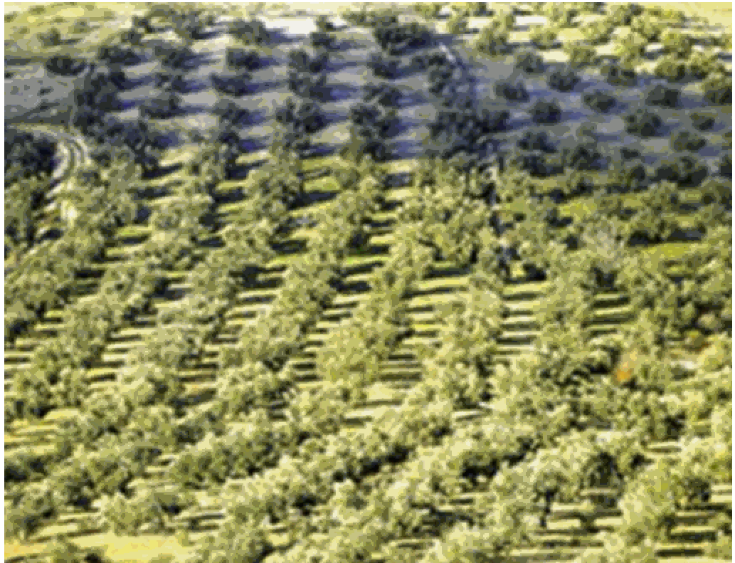
Figura. 2 Beneficios del compost en la agricultura y reforestación.

La destrucción de patógenos durante la fase termófila permite la utilización no contaminante del abono orgánico. En la Tabla 2 se recoge la temperatura y el tiempo necesario para la destrucción de algunos de los patógenos y parásitos más comunes que pueden estar presentes en el residuo a compostar.