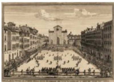
Una representación del calcio florentino durante el Siglo XVII.

Los primeros códigos británicos se caracterizaban por tener pocas reglas y por su extrema violencia. Uno de los más populares fue el football multitudinario. El football multitudinario no fue el único código de la época. De hecho existieron otros códigos más organizados, menos violentos, e incluso que se desarrollaron fuera de las Islas Británicas. Uno de los juegos más conocidos fue el calcio florentino, originario de la ciudad de Florencia, Italia. Este deporte influyó en varios aspectos al fútbol actual, no solo por sus reglas, sino incluso por el ambiente de fiesta en que se jugaban estos encuentros. El nombre 'fútbol' proviene de la palabra inglesa 'football', que significa 'pie' y 'pelota', por lo que también se le conoce como 'balompié' en diferentes regiones hispano parlantes, en especial Centroamérica y Estados Unidos. En la zona británica también se le conoce como 'soccer', que es una abreviación del término 'Association' que se refiere a la mencionada Football Association inglesa. El uso de un término u otro dependía del status de la clase social en la que se practicaba; así las clases altas jugaban al 'soccer' en las escuelas privadas mientras que las clases trabajadoras jugaban al 'football' en las escuelas públicas.